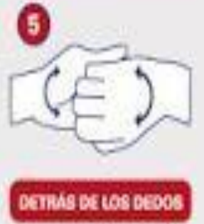
DETRÁS DE LOS DEDOS