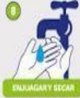
ENJUAGAR Y SECAR