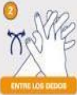
ENTRE LOS DEDOS