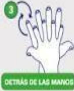
DETRÁS DE LAS MANOS