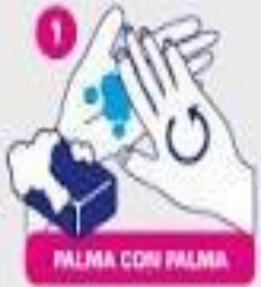
PALMA CON PALMA

Al comenzar, humedecer las manos con agua y jabón